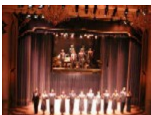
Teater Restauranten Esquina

gammelt. Her ikke er voldsomt meget at se, men beliggenheden er flot og der er mange små maleriske steder, krogede gader og stejle skråningerne.