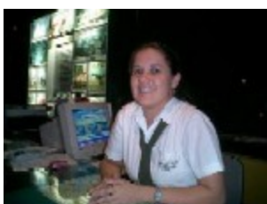
Lecielly, Paudimar Turismo