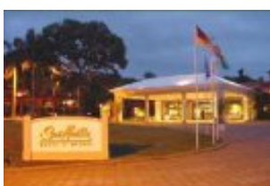
Hotel San Martin