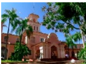
Tropical Cataratas Hotel