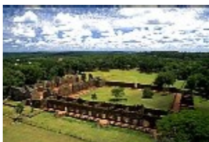
San Ignacio Ruinas