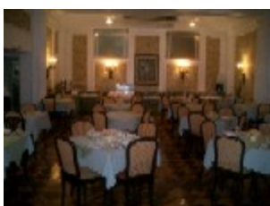
Hotel Olinda Othon spisesal

sådan reserverede man tidligere billetter..med blyant og viskelæder. På den anden side er der unge smarte drenge der underviser i det nye togbilletsystem, alt med computere og smarte farver - og sikkert flere arbejdsløse.Gå hen til lugen og køb en billet til endestationen Canuelas . Den koster næsten ingenting. Find toget, men de bliver godt fyldt op, så det kan godt være en ide at lade et køre og tage det næste. Turen får forbi den gamle del af Buenos Aires. Langsomt og larmende, dette tog er snavset, og imedens går mange forbi og sælger. Mange argentinerere er uden arbejde, man ser nydelige slipse mænd, gamle kvinder, børn..alle forsøger at leve ved salg. Ingen bliver irriterede, alle kender livet og ved at det måske er dem næste gang. Der sælges alt, fra tandpasta til hængelåse, sandwich til smykker. Alle tilbyder varen, klart og venligt, siger man nej, går sælgeren videre...slet ikke mange andre landes irriterende pressen, her virker det naturligt og giver liv på rejsen.