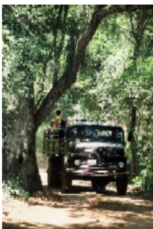
På vej til Iguacu Falls