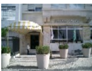
Hotel Olinda Othon