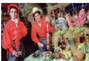
Rafain Show Restaurant