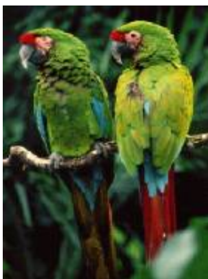
Rafain Show Restaurant