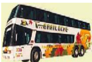
Luksusbussen fra Buenos Aires