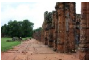
San Ignacio Ruinas